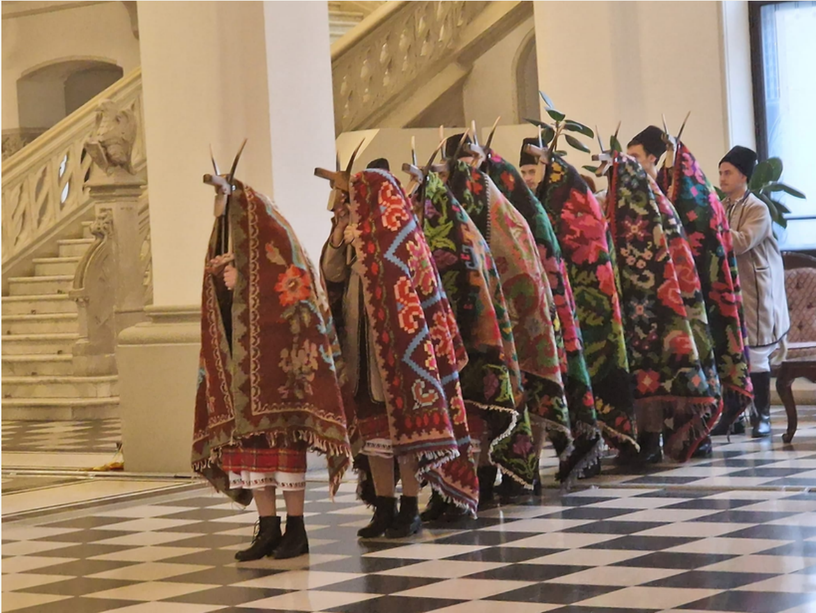
The traditional Goat play performed in the Palace of Culture, Iași, Romania

Με τη χρηματοδότηση της Ευρωπαϊκής Ένωσης. Οι απόψεις και οι γνώμες που διατυπώνονται εκφράζουν αποκλειστικά τις απόψεις των συντακτών και δεν αντιπροσωπεύουν κατ'ανάγκη τις απόψεις της Ευρωπαϊκής Ένωσης ή του Ευρωπαϊκού Εκτελεστικού Οργανισμού Εκπαίδευσης και Πολιτισμού (ΕΑΕΑ). Η Ευρωπαϊκή Ένωση και ο ΕΑΕΑ δεν μπορούν να θεωρηθούν υπεύθυνοι για τις εκφραζόμενες απόψεις.